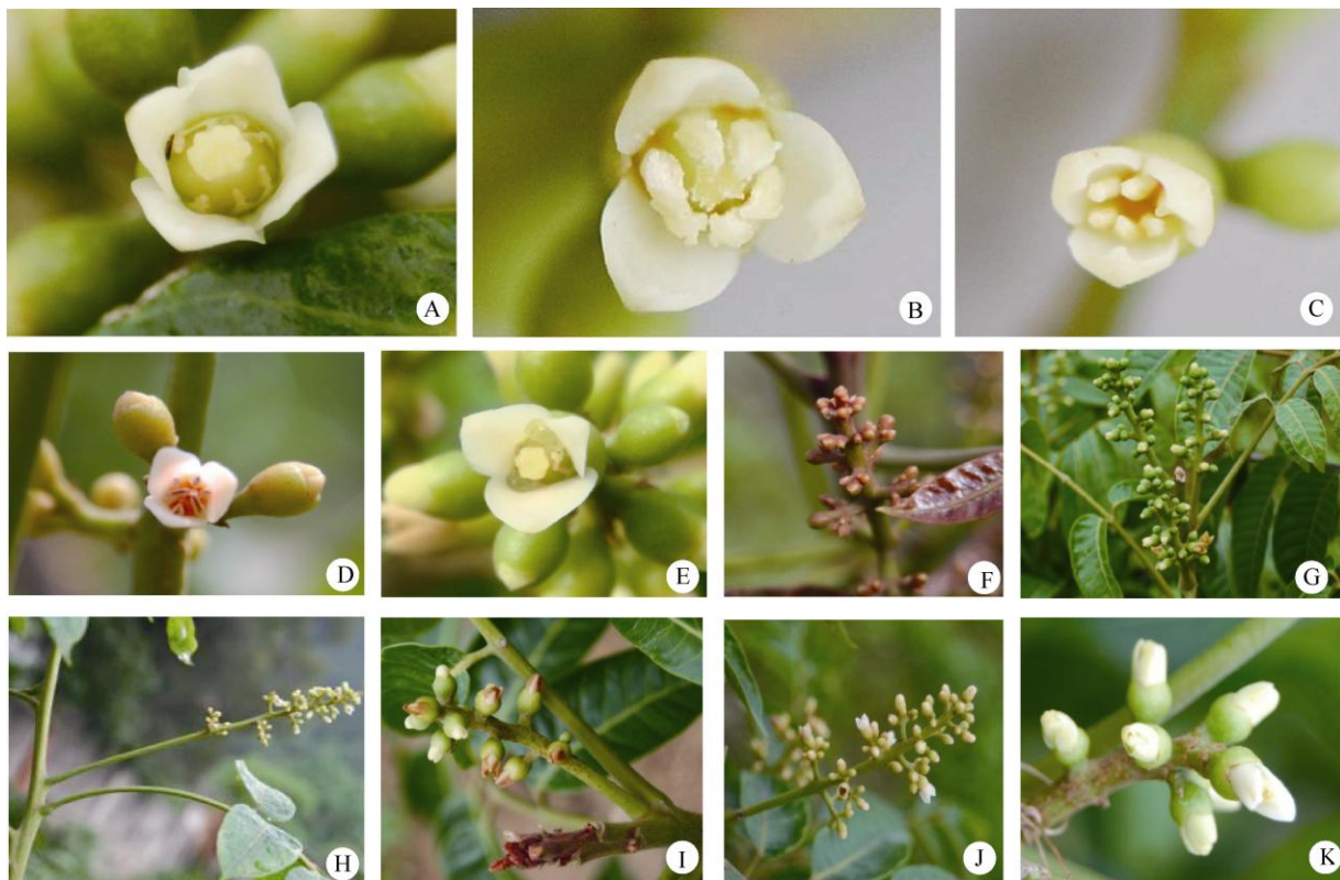
图1 橄榄花的表型性状。A: 雌花; B: 两性花; C: 雄花; D: 粉红色花瓣; E: 乳白色花瓣; F: 花序主轴红色; G: 花序主轴绿色; H: 花序腋生; I: 花序腋生; J: 圆锥花序; K: 总状花序。